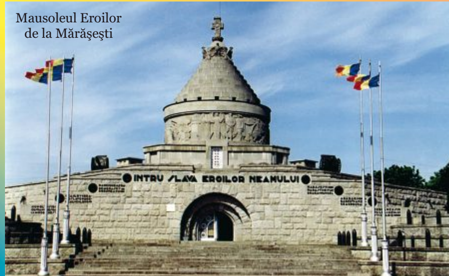
Mausoleul Eroilor de la Mărășești