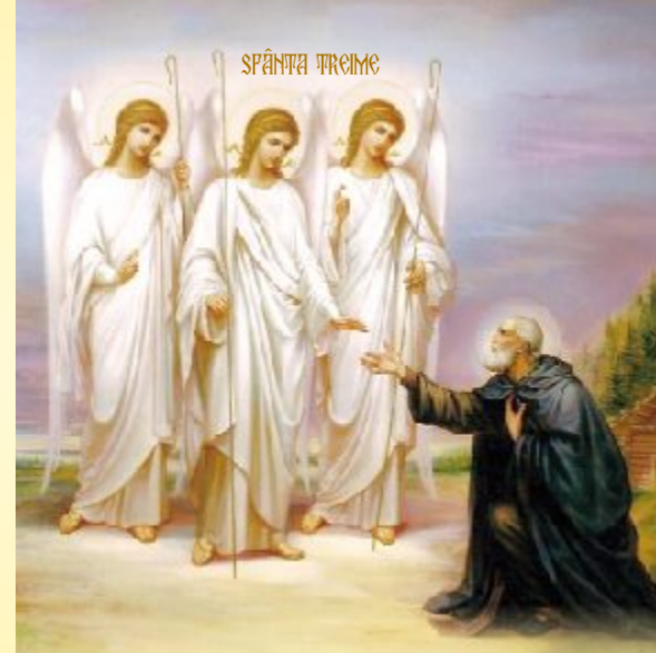
Dumnezeu se arată Patriarhului Avraam sub înfățișarea a trei Îngeri la stejarul Mamvri (Facere, cap.18)