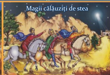
Magii călăuziți de stea