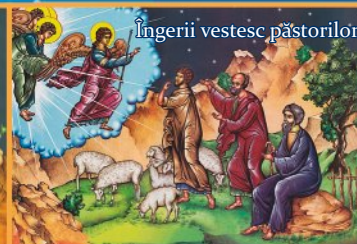
Îngerii vestesc păstorilor