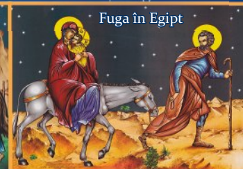
Fuga în Egipt