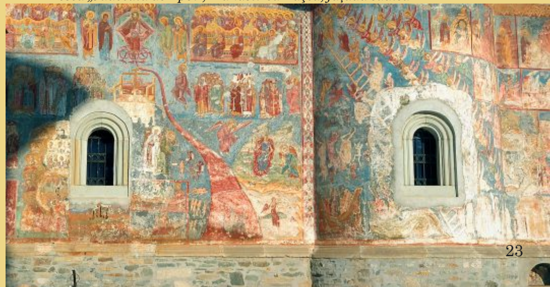
Frescă „Judecata de Apoi”, Mănăstirea Râșca, fațada sudică